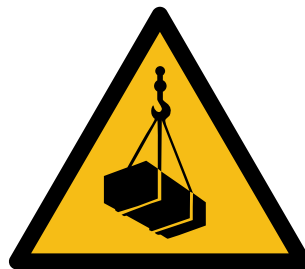
Vorsicht ! Schwebende Last