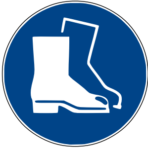
Arbeitsschuh e benutzen