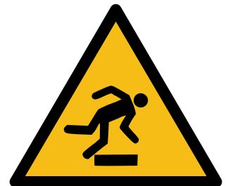
Vorsicht ! Stolpergefahr