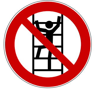
Besteigen durch unbefugte verboten

Jeder beschäftigte dieser Baustelle wird hiermit auf die möglichen Gefahren hingewiesen und aufgefordert die entsprechenden Vorkehrungen zu treffen.