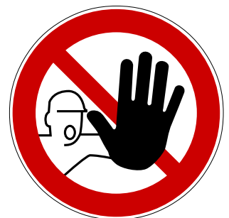
Zutritt für Unbefugte verboten